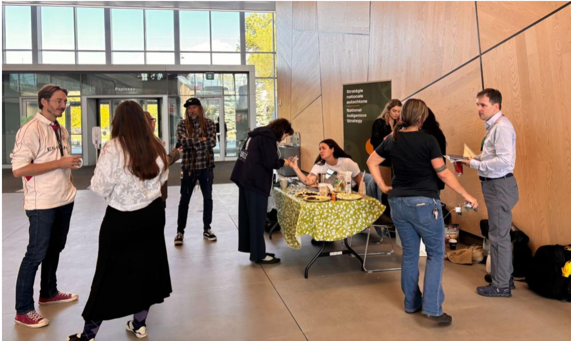
Les membres du Bureau autochtone discutent de la stratégie nationale autochtone avec des employés à la Maison de Radio-Canada, à Montréal. (Btissame Arouss)

Résultat stratégique : Augmentation du nombre d'œuvres d'art et d'objets authentiquement autochtones acquis à CBC/Radio-Canada.