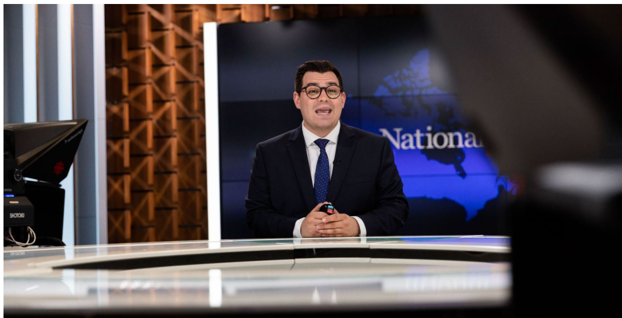
Un de nos plateaux de tournage.