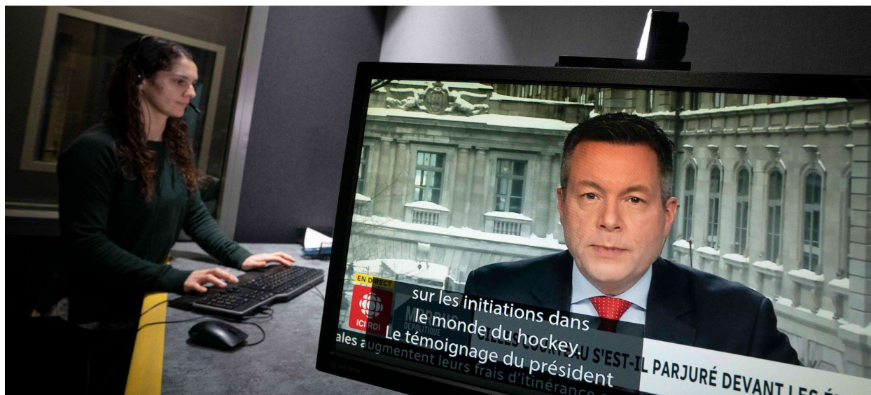
En studio dans la nouvelle Maison de Radio-Canada à Montréal.

Les services audiovisuels autorisés de CBC/Radio-Canada 4 doivent respecter plusieurs conditions de licence établies en vertu de la Loi sur la radiodiffusion et portant sur l'accessibilité, tout spécialement la fourniture de sous-titrage, de vidéodescription et de description sonore dans sa programmation. Les conditions de licence pertinentes pour la reconnaissance, l'élimination et la prévention des obstacles sont expliquées ci-dessous, accompagnées de leurs sources. Les paragraphes 9(4) ou 10(1) de la Loi sur la radiodiffusion n'énoncent aucune ordonnance ou règle s'appliquant à CBC/Radio-Canada et portant sur la reconnaissance, l'élimination ou la prévention des obstacles.