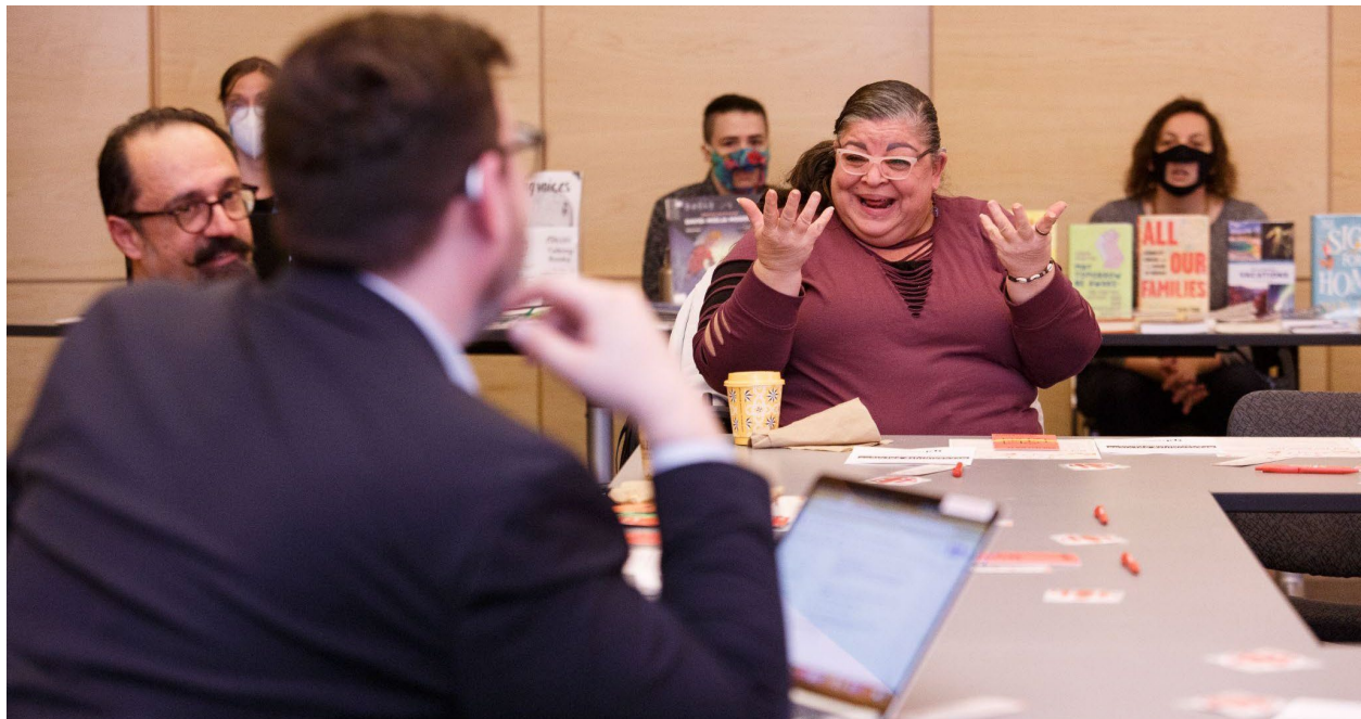
À la Bibliothèque publique de Toronto, lors de l'une de nos consultations sur l'accessibilité.

L'expérience des personnes en situation de handicap a d'emblée motivé et orienté l'élaboration de ce plan. La démarche s'est amorcée à l'interne, avec l'appui de nos deux conseils consultatifs des personnes en situation de handicap. Les consultations externes se sont échelonnées de novembre 2022 à janvier 2023, et les consultations avec les membres du personnel se sont poursuivies jusqu'en mars 2023. C'est sur les propos recueillis lors de nos consultations internes et externes que s'appuie le plan sur l'accessibilité de CBC/Radio-Canada pour 2023-2025.