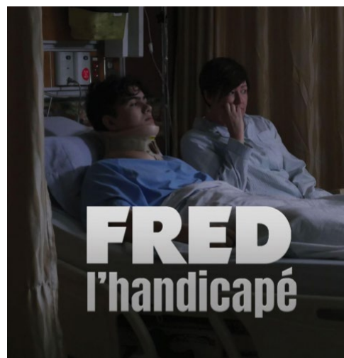
Fred l'handicapé, une mini-série de Radio-Canada.