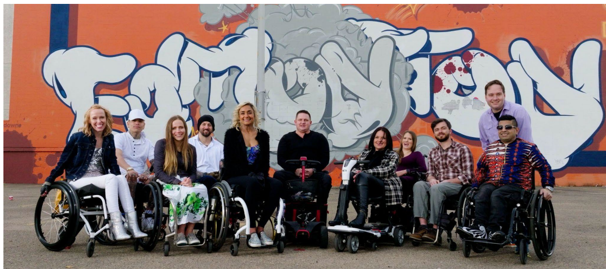
PUSH, une série non scénarisée de CBC.