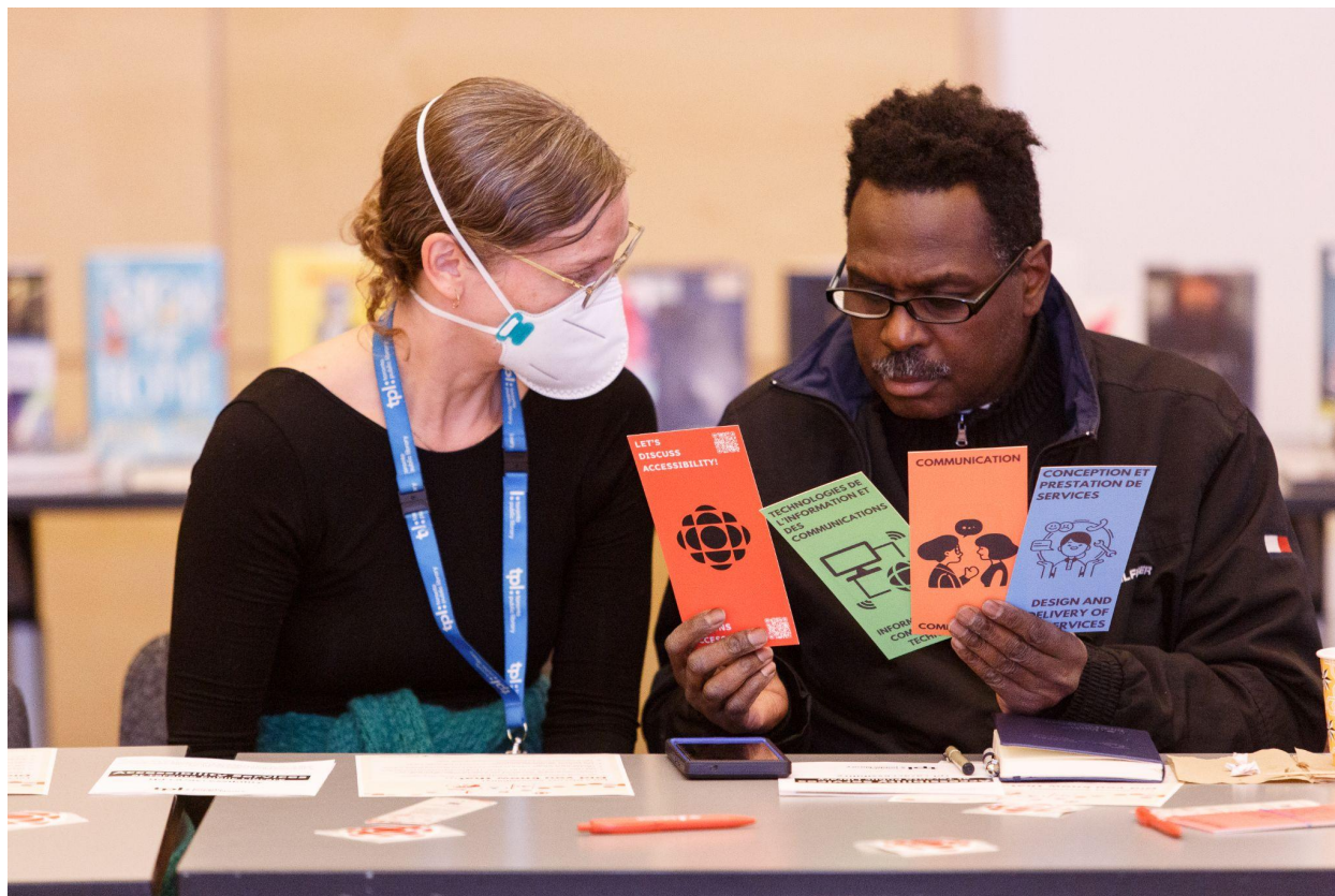
À la Bibliothèque publique de Toronto, lors de l'une de nos consultations sur l'accessibilité.

Enfin, ce plan n'aurait pas été possible sans la contribution des nombreux membres du personnel qui ont aidé à son élaboration sans ménager leurs efforts. Notre plan est véritablement propulsé par l'apport des personnes en situation de handicap, et nous les remercions de contribuer à faire de CBC/Radio-Canada le diffuseur public exempt d'obstacles que le Canada mérite.