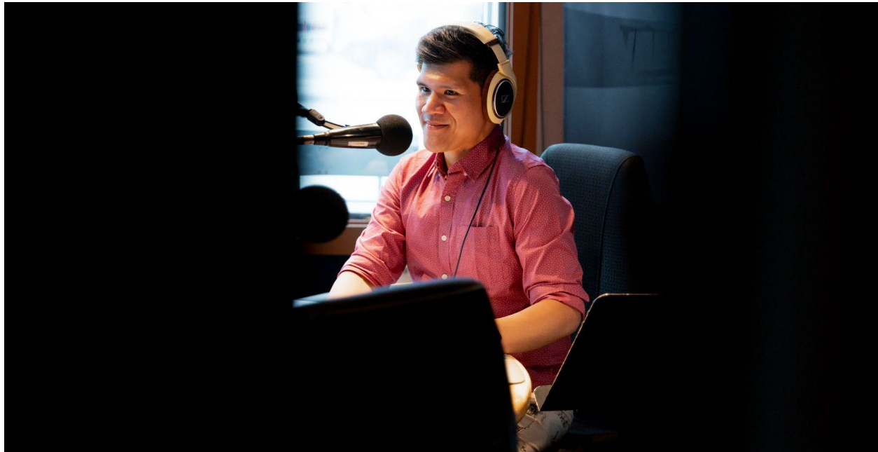
Un de nos studios d'enregistrement à Winnipeg.

La communication est au cœur même des activités du diffuseur public national. La présente section aborde les activités de communication liées à l'emploi, à l'environnement bâti et au transport. Les activités de communication liées à l'acquisition de biens, de services et d'installations sont présentées à la section Acquisition de biens, de services et d'installations . Les activités de communication liées à la conception et à la prestation de programmes et de services (contenu télévisuel, contenu radio et contenu numérique) sont présentées à la section Conception et prestation de programmes et de services .