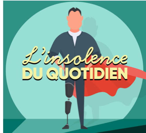
L'insolence du quotidien, balado de Radio-Canada OHdio mettant en vedette des personnes en situation de handicap.