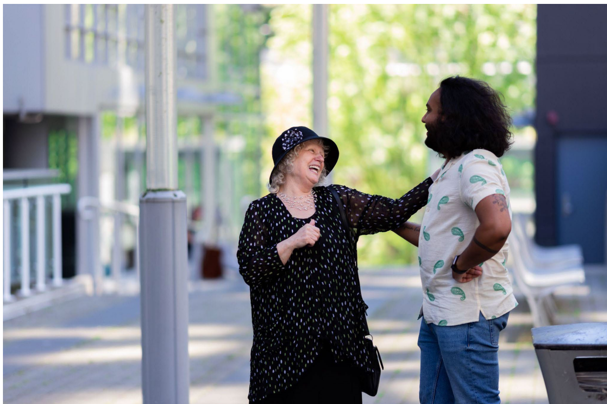
Station de CBC/Radio-Canada à Vancouver.