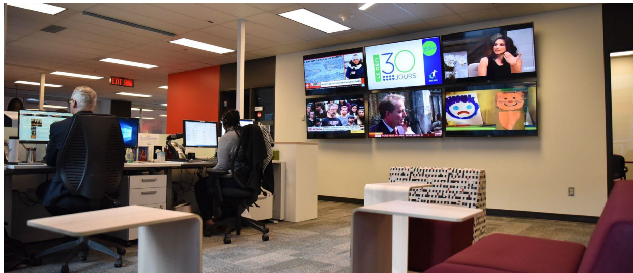
Station de CBC/Radio-Canada à Ottawa.