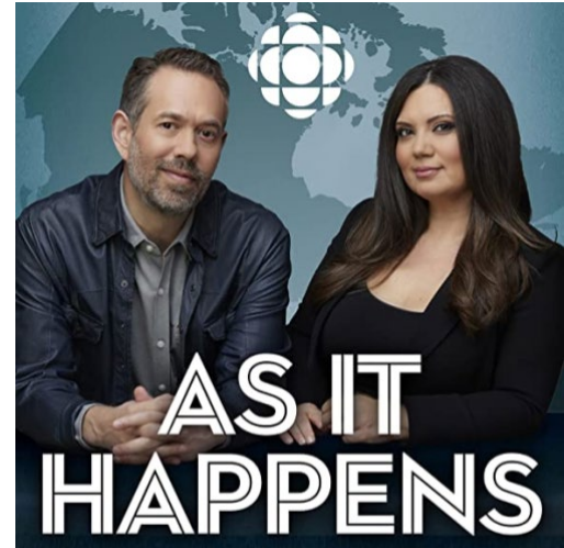
As It Happens, émission de CBC Radio One offerte avec la transcription intégrale.