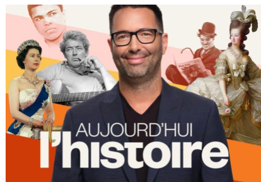
Aujourd'hui l'histoire, émission d'ICI RADIO-CANADA PREMIÈRE offerte avec la transcription intégrale.