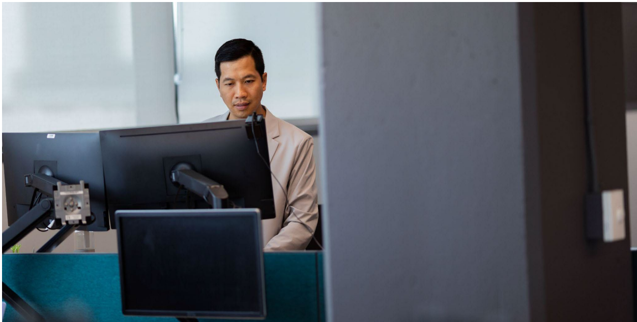
Un de nos espaces de travail.