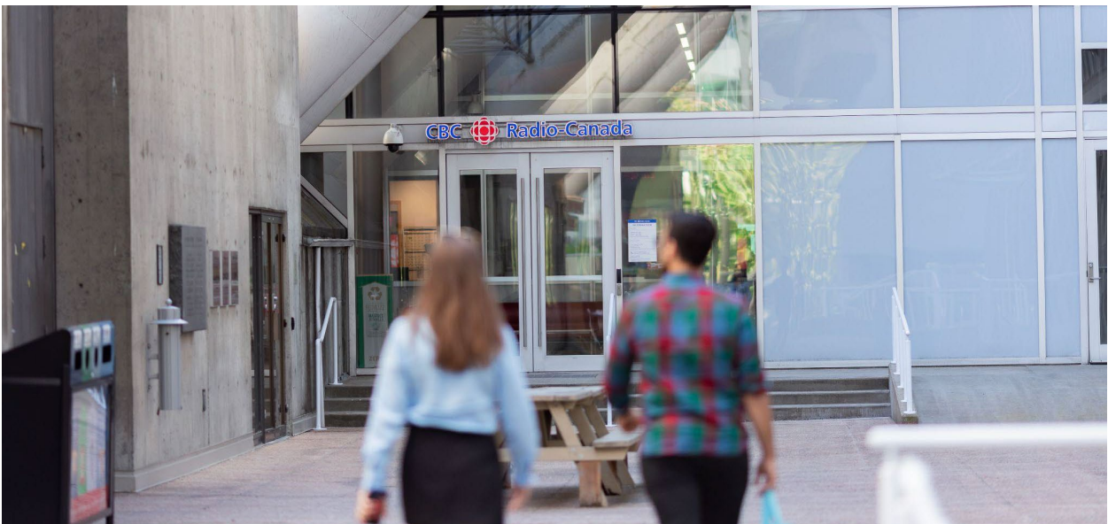
Station de CBC/Radio-Canada à Vancouver.