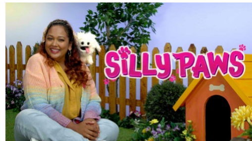
Silly Paws, émission de CBC Gem en ASL (langue des signes américaine).