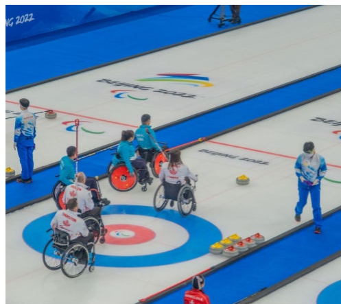
Jeux paralympiques. Curling. Jeux paralympiques d'hiver de Pékin 2022 - Curling en fauteuil roulant.