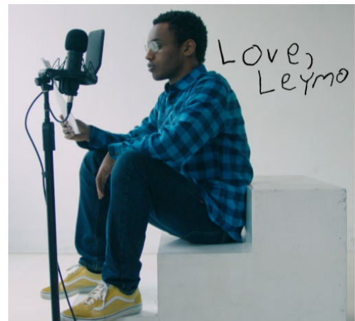
LOVE, LEYMO, documentaire de CBC.