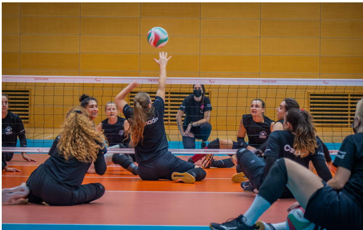
Jeux paralympiques. Volley-ball. Entraînement de volley-ball assis - Femmes canadiennes 2021 Tokyo, Japon.

CBC/Radio-Canada s'est engagée à refléter la diversité de ce pays dans toute sa richesse, en mettant en valeur nos différentes perspectives et tout ce qui nous rassemble. Cette volonté implique de représenter les personnes en situation de handicap dans nos contenus. Nous voulons poursuivre nos efforts en ce sens, avec l'intention de véritablement toucher nos auditoires. Nos démarches se révéleront concluantes lorsque nous mesurerons une perception plus positive chez les personnes qui consomment nos contenus.